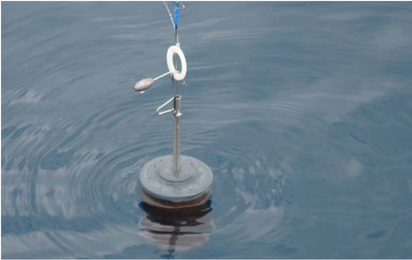
El Practix, a punto de iniciar el descenso hacia el fondo.