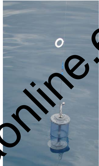
Tras llegar al fondo y dejar su contenido, el Practix vuelve vacío y limpio.

sencillo y eficaz, y no necesita pilas, muelles ni otros resortes sujetos a desgaste o roturas cuando más lo necesitas. Además, ocupa muy poco espacio y no pide pan... Este aparato es fabricado y distribuido por Megamar, quien lo comercializa directamente a los aficionados en su propio establecimiento